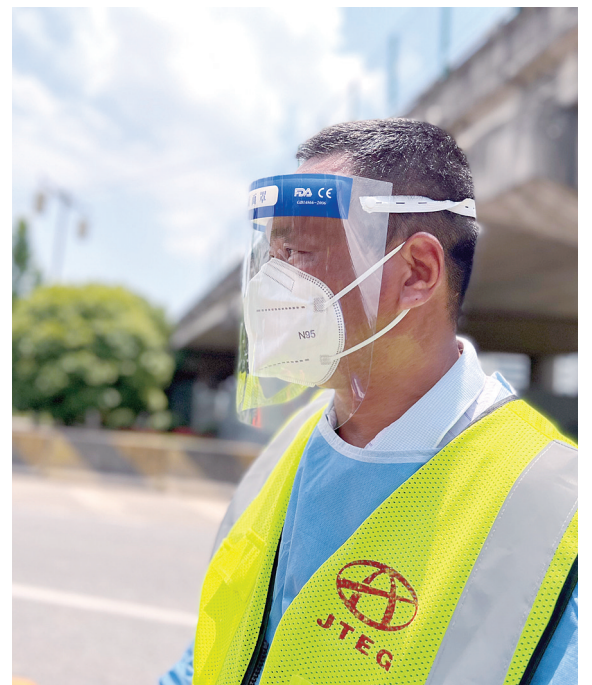
烈日下的抗疫志愿者。