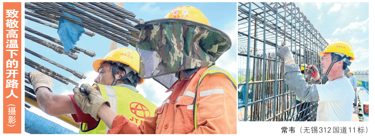
致敬高温下的开路人(摄影)