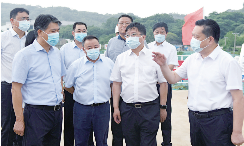
徐曙海(右一)调研镇江312国道1标。

徐曙海一行实地察看了镇江312国道城区1标箱涵施工现场以及主线跨243省道桥施工现场,听取了项目建设情况介绍,对当前工程进展表示肯定。他指出,交通项目建设是经济社会高质量发展的重要支撑,惠民生、促发展、意义重大。他要求,各有关部门以及乡镇和街道要高度重视,扎实做好群众工作,妥善处理各类矛盾问题,加快征地拆迁进度;要抓住当前施工“黄金期”,组织好工程施工,在保证质量和安全的前提下,切实加快项目进度。他强调,施工企业要扛起主体责任,加强施工现场管理,落实安全生产和环保措施,确保工程高质量建设。