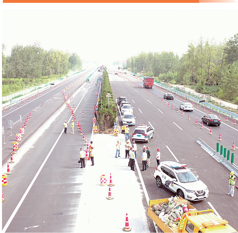
近日,京沪高速淮安21标K794-K804段第三阶段交通导改圆满完成,为冲刺完成京沪扩建淮段今年底双向八车道通车目标奠定了坚实基础。据悉,本月项目还需进行3次导改,涉及路线约20公里。