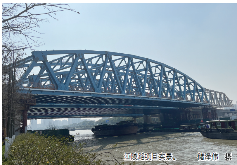
江陵路项目实景。

保质保量地完成了四幅钢桁架的顶推工作,确保项目如期、高质量完成。本次北辅道钢桁架桥顺利完成顶推为项目进度推进迈出关键一步,吹响了最后冲刺的号角。后续,项目全体人员将上下一心,齐心协力,提效率,抓工期,以精细化、规范化、高质量标准打造精品工程。