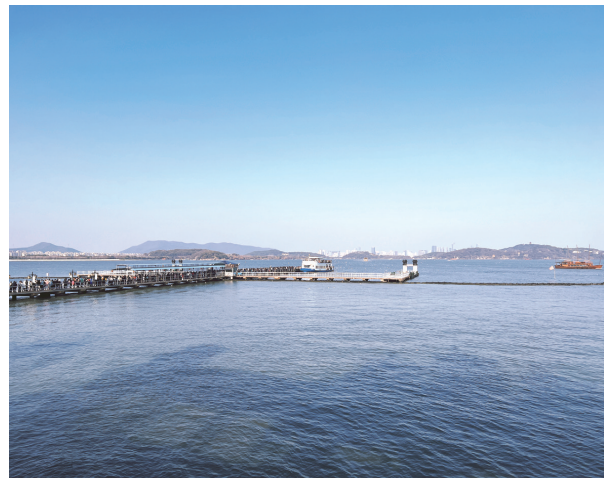
春景组图