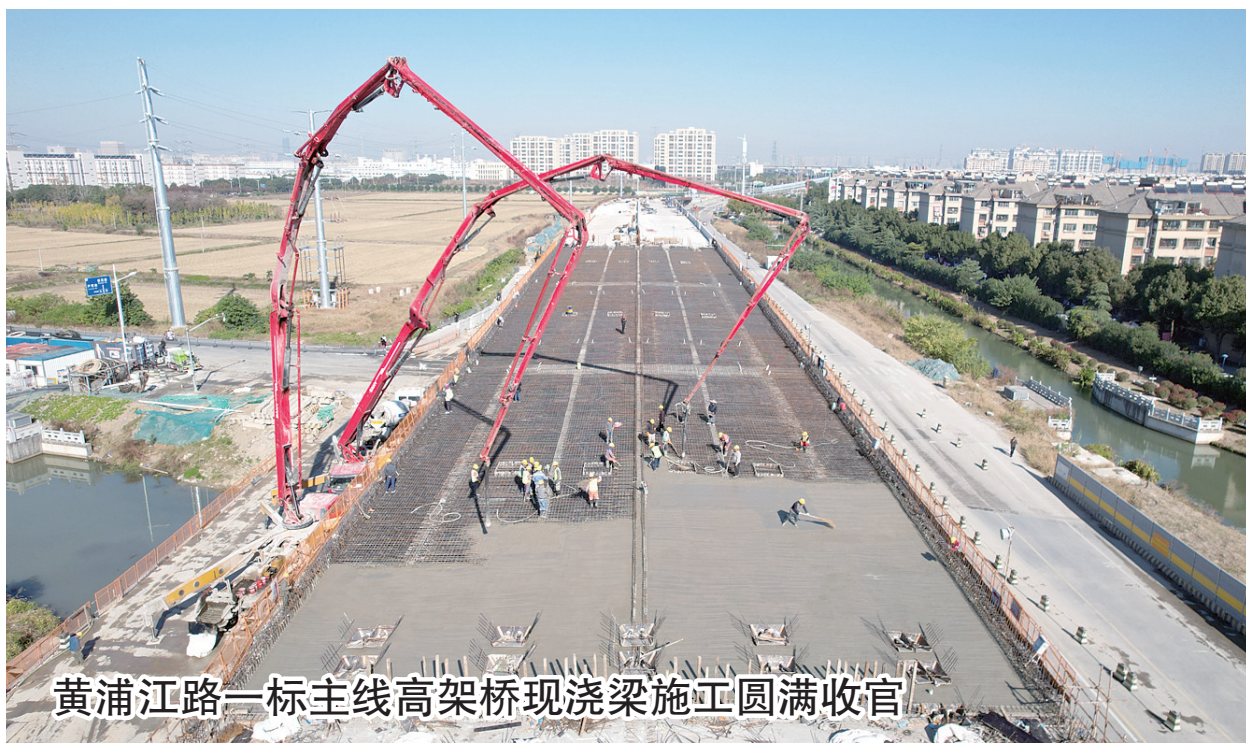
黄浦江路一标主线高架桥现浇梁施工圆满收官

水火无情,生命无价。本次活动为全体职工上了一堂生动的安全教育课,增强了职工的自我保护意识。今后,项目部将继续加强消防安全生产工作,切实筑牢安全“防火墙”。