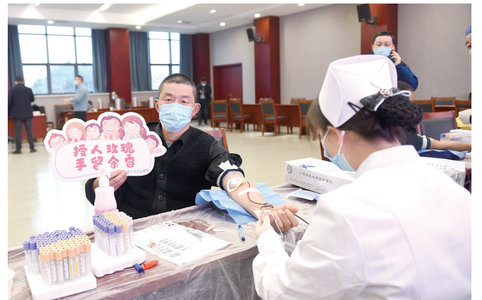
集团职工积极参与无偿献血。

涓涓细流传递真情,汨汨热血温暖人心。作为公益事业的倡导者,参与者,集团知责于心、担责于身、履责于行,连续25年组织集体无偿献血活动,用爱心传递温暖力量,用奉献托起生命的希望。