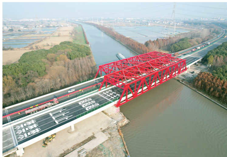
项目建成通车

大桥改建完成后,将进一步推进长三角地区内河集装箱通道网建设,畅通太仓港区疏港航道,促进太仓港产城一体化发展,同时满足人民群众日益增长的出行需求,实现航道效益与公路效益双赢。