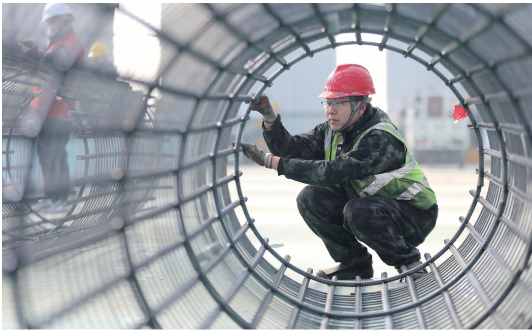
注视(摄影) “摄影进工地 拍照过大年”活动作品

父母力所能及给予我们成长的环境与氛围,也给了我们无穷的勇气与力量。他们的思想和观念,是所处的那个时代和环境的产物。当意见相悖时,更多的应该是理解,对于他们已形成的根深蒂固的习惯,应求同存异。在人生道路上我们应该抓住每一个机遇,走好每一步,做好每一件小事,聚沙成塔,最终找到自己的归属。同时也要站在父母的角度多多考虑。小的时候我们觉得父母是伟大的,无所不能的,以他们为荣。现在我们应当要让父母以我们为骄傲,带着他们的祝愿走好未来的每一步。