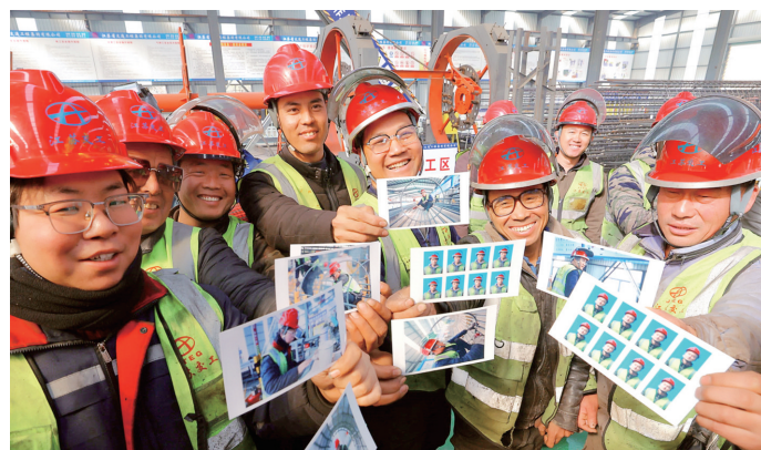
工人们喜笑颜开的动人景象。

此次“摄影进工地 拍照过大年”活动走进谏壁一线船闸扩容改造工程,用镜头记录下工人们的建设风采和精神面貌,体现了上级领导对广大“开路人”的深情关怀和对谏壁一线船闸扩容改造工程的深切关注。后续,项目部将继续锚定目标,齐心协力,狠抓质量进度管理,着力在创新驱动上蓄能,在安全生产上加码,在协调沟通上做细,全力将谏壁一线船闸扩容改造工程建成标杆与典范,为长江经济带高质量发展注入强劲的水运动力。