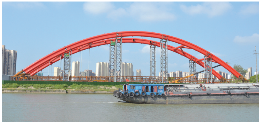
苏州高垫大桥右幅顺利合龙。

8月13日，从施工现场传来喜讯，项目主桥135米钢桁架全部架好，东引桥、西引桥板梁架设全部完成，大桥桥梁实现全线贯通，大桥全面进入附属设施（排水、护栏、机电）路面工程的施工。收官战的号角已经吹响，全体参建人员整装待发，以争分夺秒之势，以更加饱满的热情