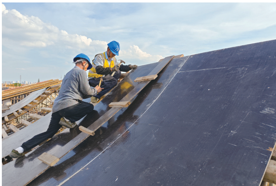
攀登(摄影) 刘莉莹(常州腾龙大道7标)

让我们在这“东作西成”的漫漫旅程中，怀揣着深深的希望与无畏的勇气，用心去书写独属于自己的精彩篇章，去欣然迎接那专属于我们的美好收成。无论遇到何种艰难险阻，都默默告诉自己，坚定地坚持下去，那丰收的辉煌时刻必将如约而至。