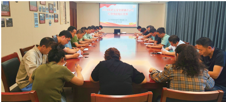
职工认真参与考试。

本报讯(记者 诗颖)8月20日,集团2024年职工安全健康意识与应急技能知识竞赛落下帷幕,集团总部、子公司以及直属项目部等21家单位共计1600余名职工参与竞赛,在集团上下掀起了全员学习安全生产知识的热潮。