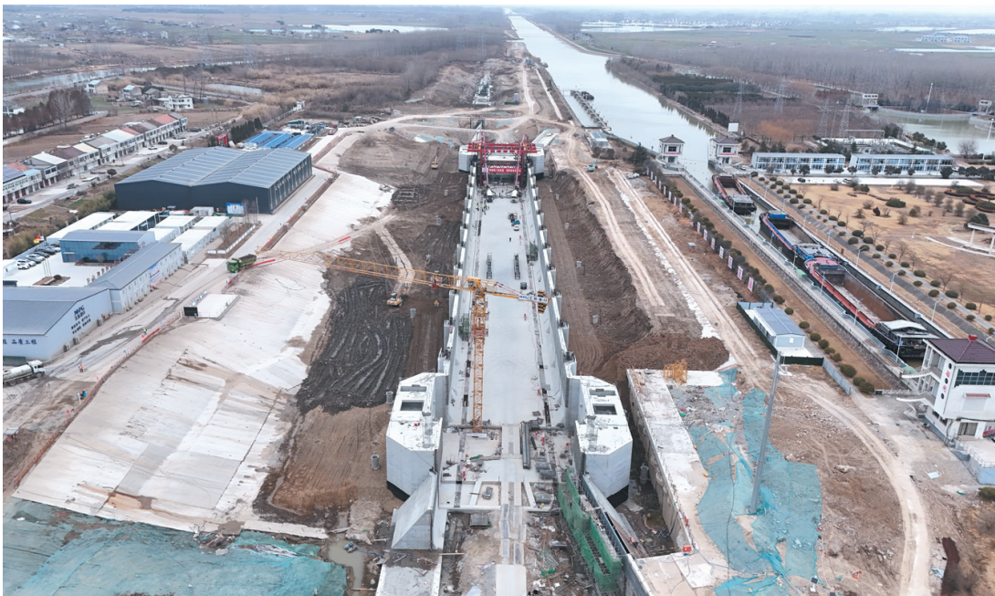
连申线大套二线船闸施工正酣。

在党建引领与先锋带动下，项目部通过优化施工方案、共享临建设施、科学组织施工等措施，累计节约成本数百万元。通过调