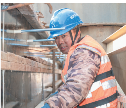
建设者主动放弃假日休息,坚守岗位,奋斗在生产一线。

本报讯(通讯员 解晓松)2026年元旦之际,德胜河航道整治工程(桥梁工程)DSH-QL-SG3标施工现场呈现出一片热火朝天的繁忙景象。建设者主动放弃假日休息,坚守岗位,全力保障工程进度,以“开局即决战”的奋斗姿态,在新年奋力开创新佳绩。