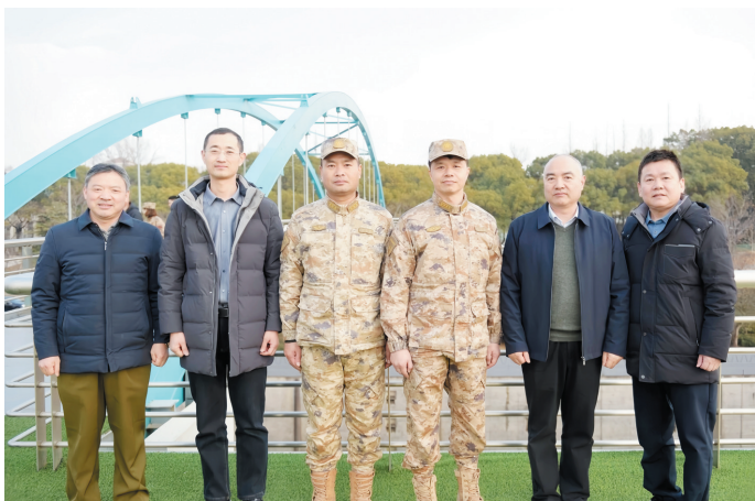
合影留念。

怀前进副司令员对集团长期支持国防事业表示感谢。他指出,通过此次走访,深切感受到集团是一家具有红色基因、国防情怀和责任担当的优质企业。他希望企业进一步发挥自身优势,