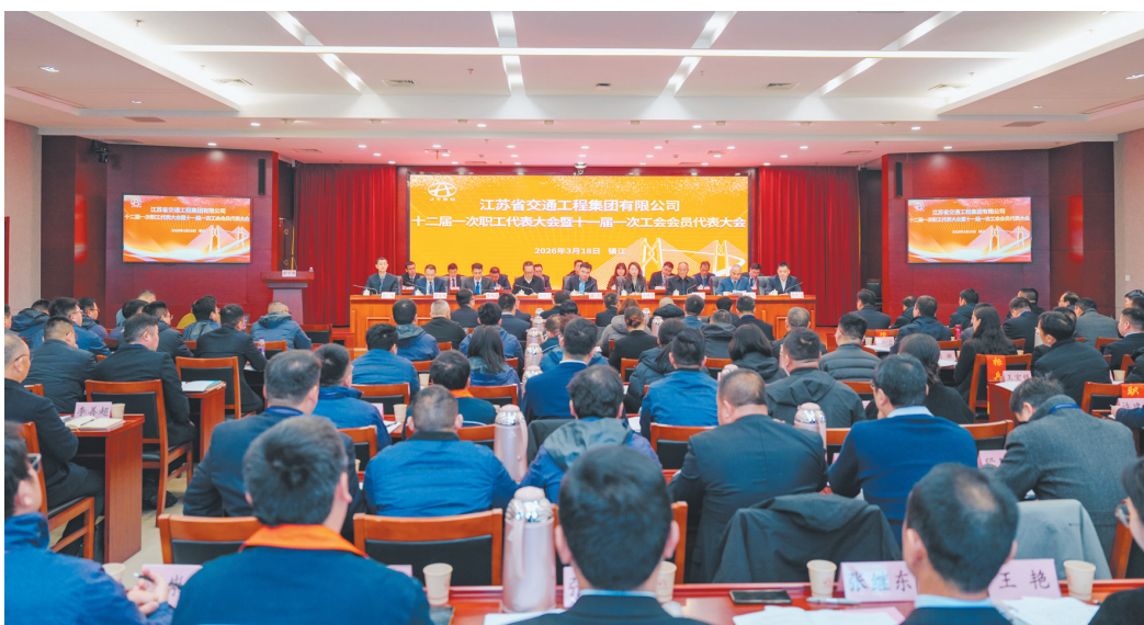
“两代会”现场

大会选举产生了集团第十一届工会委员会、工会经费审查委员会,通过了本届职代会相关专门委员会组织成员名单,组织了第十一轮《集体合同》签字仪式,表彰了2025年度行政和工会条口涌现出的部分先进集体和个人代表。会议期间,代表们以高度的责任感和使命感,认真听取并审议了各项报告,表决通过了集团第十一轮《集体合同》《不定时工作制度和综合计算工时工作制实施方案》《不再设置监