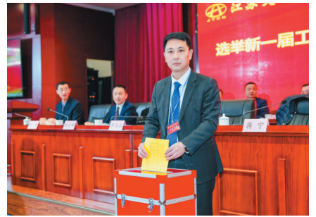
投票选举。

新高度;二是聚焦主责主业,投入发展大局,在助推高质量发展上彰显新作为;三是恪守为民情怀,做实维权服务,在构建和谐劳动关系上实现新提升。