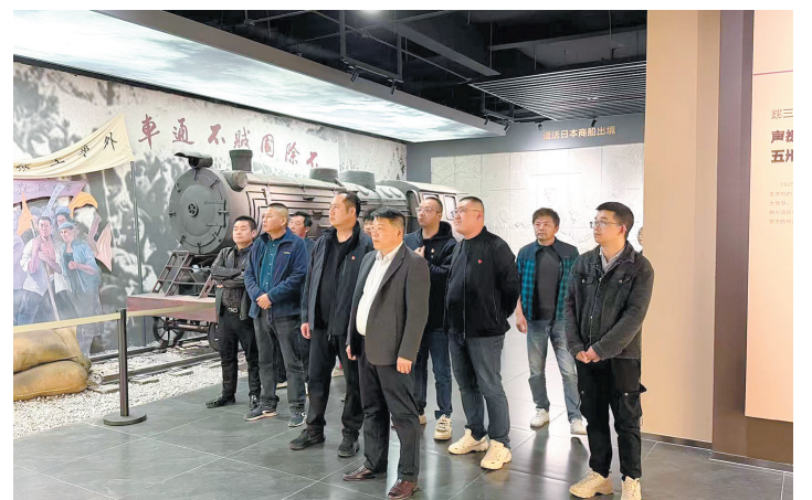
缅怀革命先烈,凝聚奋进力量。